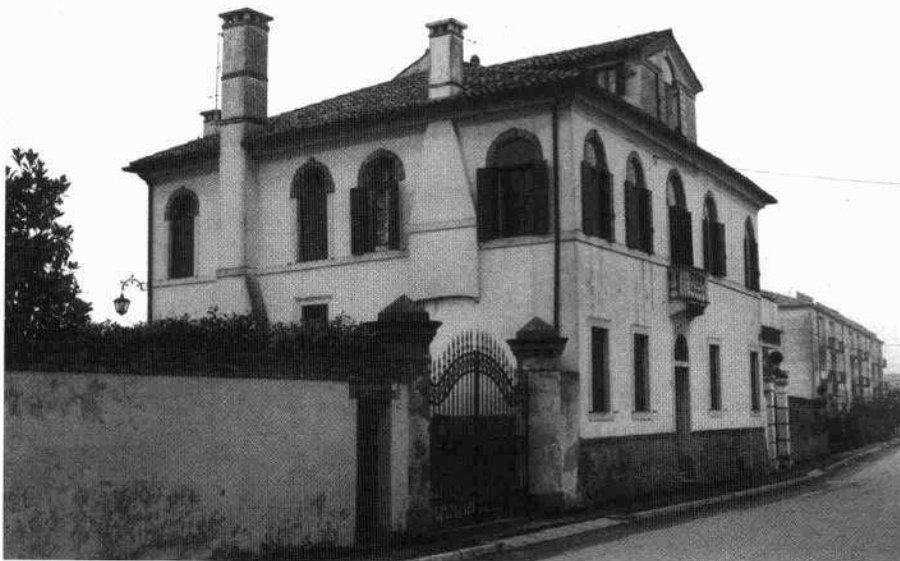
Particolare della porta finestra con balcone in pietra La villa vista da oriente

A sinistra sorgono le adiacenze, coeve alla villa nell'impianto, appena al di là della corte cui si accedeva, e si accede, attraverso gli originali pilastri che sostengono il portale. In esse erano inserite l'abitazione del gastaldo, le stalle, i ripostigli, tutti volumi riproposti e mantenuti nel restauro, con l'abitazione posta in testa verso la strada, poi l'area porticata a due fornici con all'interno la stalla, quindi i vani ad uso depositi ed il secondo portico aperto verso la campagna.