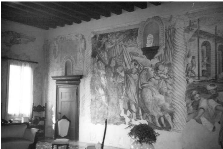
Scorcio del salone affrescato

perché oggi esso conserva solo due archi mentre la loggia ne ha tre.