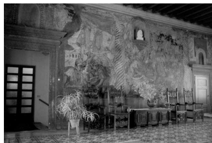
Scorci del salone affrescato