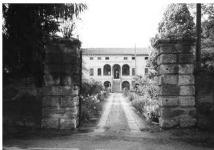
Veduta del viale che conduce alla villa