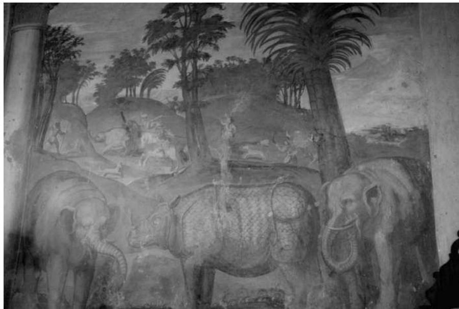
Particolare dell'affresco con soggetto esotico

I caratteri stilistici la collocano sicuramente nel periodo di transizione tra il tardo rinascimento e il manierismo e cioè tra il 1560 e il 1580 anche se l'impostazione architettonica dell'edificio padronale si scosta dalle tradizioni legate all'ambiente veneto.