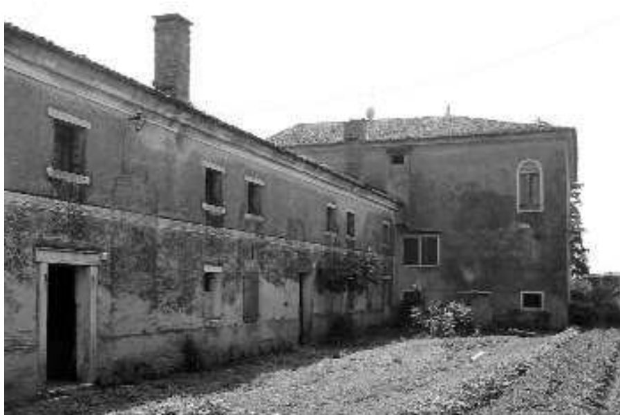
Il fronte laterale

Tutto il complesso si presenta in un mediocre stato di conservazione.