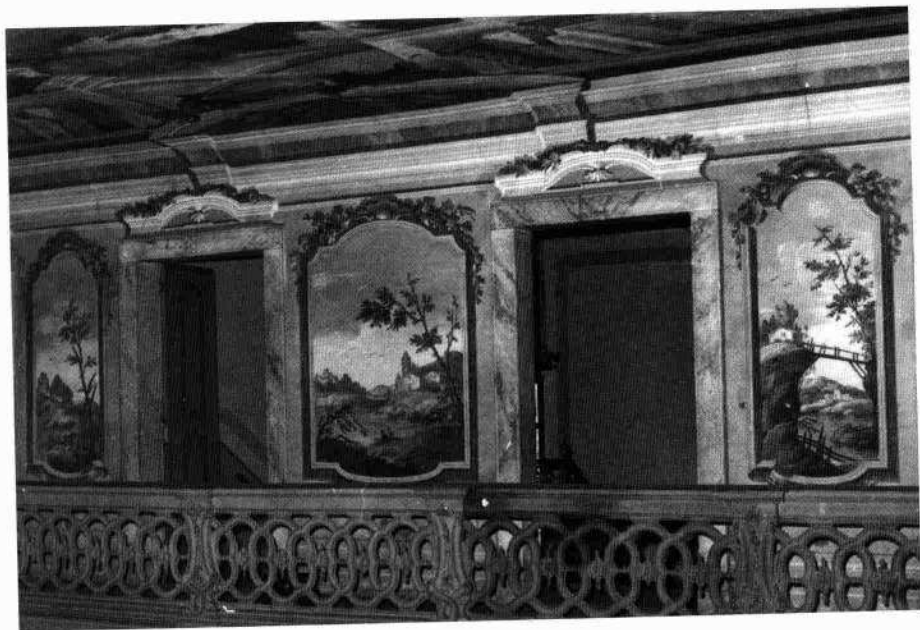
Il viale delle statue Il salone affrescato