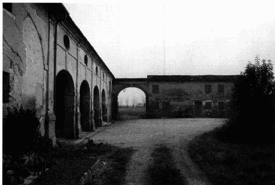
Il complesso visto da est Le barchesse e le adiacenze

Tutte le aperture del piano nobile hanno cornice in pietra con listello modanato di coronamento. Sopra le soffitte, aerate da piccole finestre quadrate, una cornice a dentelli sostiene la copertura, a quattro falde collegato nel colmo. Un ampio arco a pieno sesto, poi tamponato, si frappone tra la villa e la barchessa orientale, aperta invece in forni con sesto ribassato su pilastri; su essi sono addossate snelle lesene che, superato il piano soprastante, aperto in oculi ovali assiali alle chiavi degli archi, sostengono l'architrave su cui poggia il tetto.