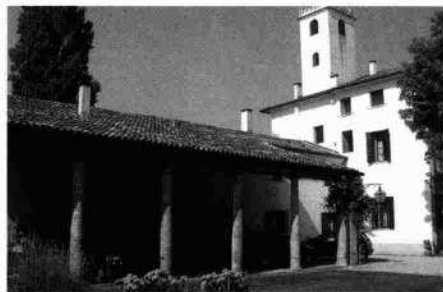
Il fronte meridionale Particolari delle barchesse occidentale e orientale