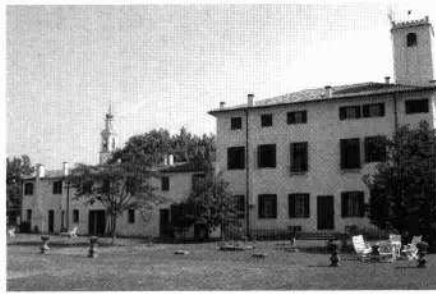
La facciata dell'oratorio dalla strada statale Il corpo padronale con la torretta Veduta dall'alto del complesso da una fotografia d'archivio Il fronte meridionale del complesso visto dal giardino