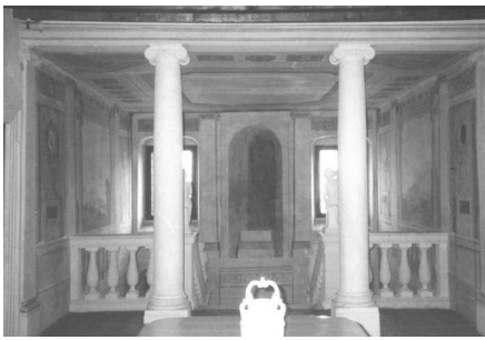
Scorcio della scalinata interna a due rampe (Archivio IRVV)

Veduta di una delle pareti dipinte con finti loggiati e vedute prospettiche di rovine greco-romane (Archivio IRVV)