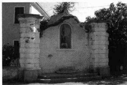
Il portale del fronte settentrionale La facciata meridionale dal brolo Particolare degli annessi occidentali Il capitello di S. Antonio