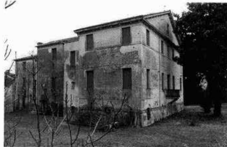
Il volume occidentale La corte tra i due corpi di fabbrica Il collegamento tra i vari annessi Parte del corpo padronale visto da nord