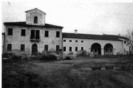
Veduta del complesso dalla strada prima dei lavori di restauro Il corpo padronale e gli annessi occidentali ed orientali