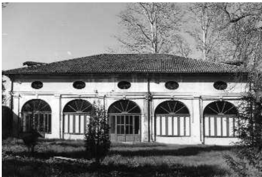
Il prospetto meridionale della barchessa occidentale in una foto d'archivio

Il portico delle barchesse ha bucatore chiuse da serramenti o parzialmente tamponate: i due archi all'estremità destra dell'edificio orientale sono stati ridotti infatti ad accessi con piattabanda, delimitati lateralmente da conci in pietra squadrati. Le arcate,