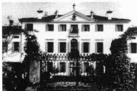
Particolare del fronte nord della villa con il giardino geometrico (Archivio IRVV) L'oratorio (L.S. 1998) La cancellata che riquadra il fronte principale (Archivio IRVV)