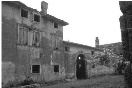
Scorcio sugli annessi rustici (Archivio IRVV) Parte della facciata principale prospiciente la strada (Archivio IRVV)