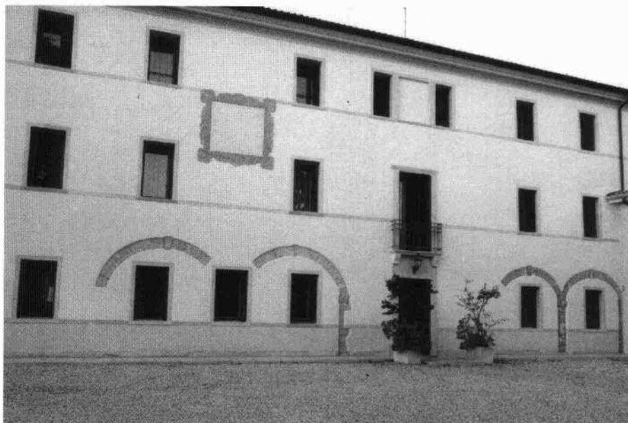
L'oratorio prospiciente la strada (Archivio IRVV) Il fronte sud della villa (Archivio IRVV)

Un'apertura simile si colloca al primo piano dove la monofora che segna il centro della facciata è completata da un piccolo poggiatesta, con sbalzo modanato e mensoline di sostegno in pietra.