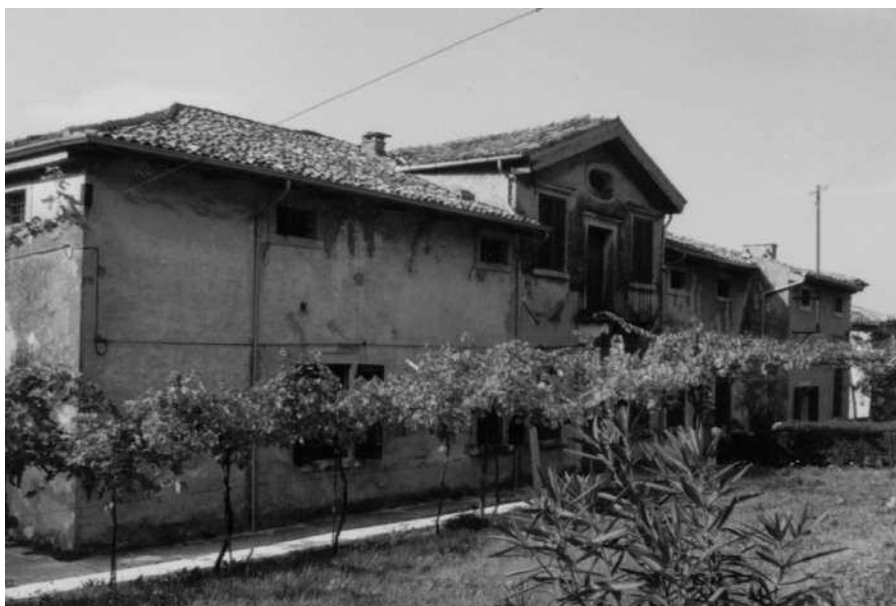
Scorcio del prospetto occidentale della villa e della scalinata che sale al giardino superiore (Archivio IRVV)