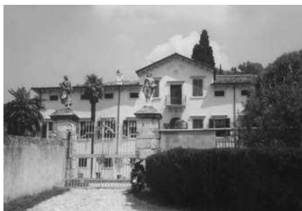
Veduta della villa e del cancello d'ingresso al complesso dalla strada pubblica (Archivio IRVV) Scorcio dell'edificio rustico che affianca la villa a sinistra e della scalinata che porta al piano superiore del giardino (Archivio IRVV)