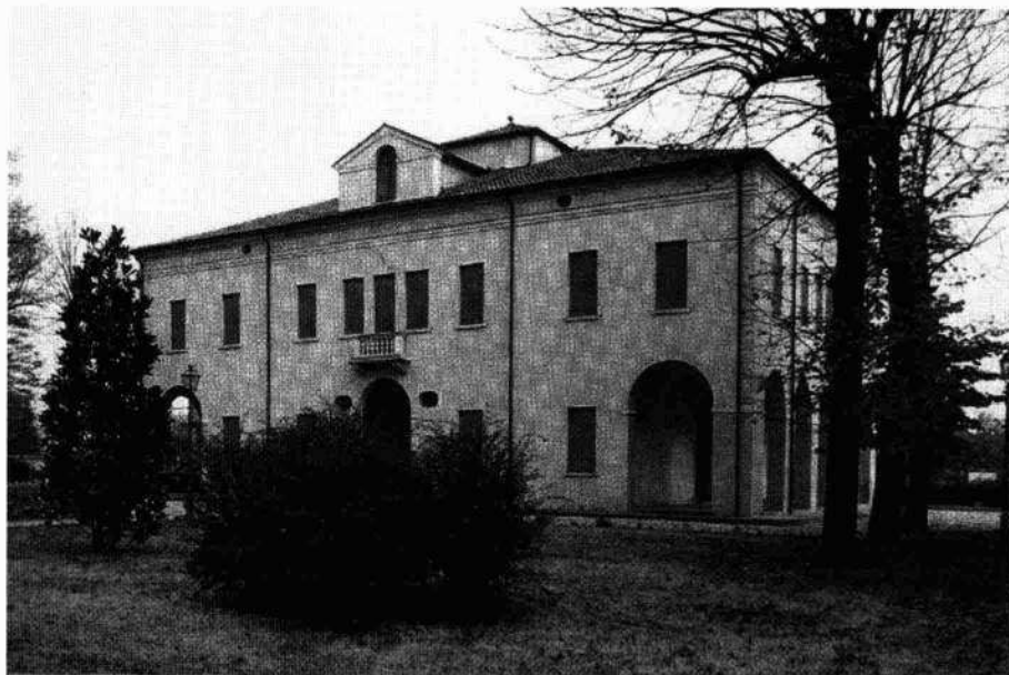
Il complesso nella "Gran Carta del Padovano" di Rizzi Zannoni (1780) Veduta della facciata meridionale verso il parco

Gli interni presentano alcuni elementi di arredo particolari quali una vasca ed un camino in porfido, una scala cinquecentesca in pietra, la cui posizione può sostenere la tesi della presistenza dell'impianto, eleganti soffitti nelle stanze, capriate lignee a sostegno del tetto.