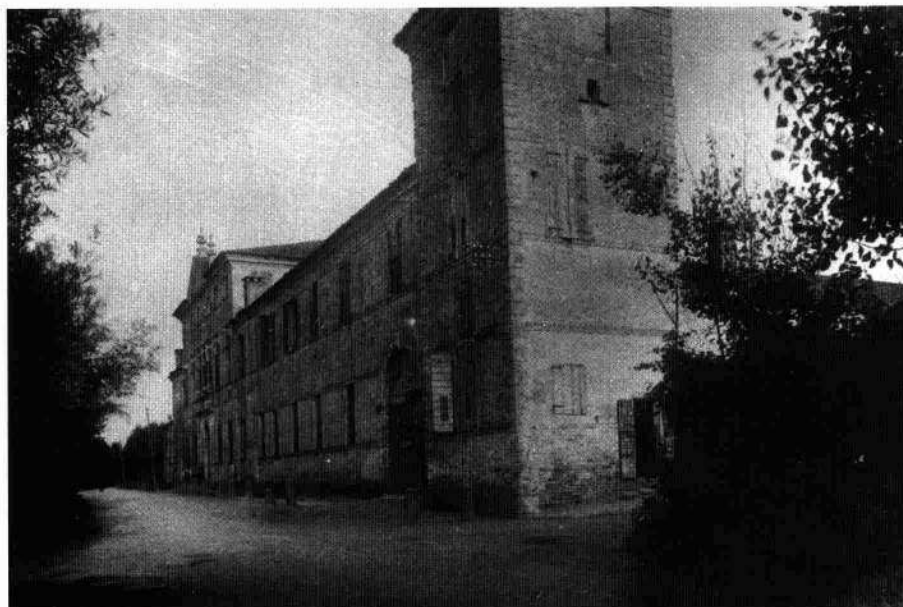
Il fronte retrostante prima dei restauri Il prospetto principale agli inizi del secolo XX

Il fronte principale si apre sulla strada, dopo alcuni gradini in trachite, con portale archivoltato, contornato da cornice modanata con mascherone in corrispondenza della chiave. La coppia di finestre ai lati ha semplice contorno liscio, collegato in architrave e soglia con fasce che corrono lungo i prospetti intersecando le finestre della scala e trasformandosi, in corrispondenza della soglia del piano primo, in marcapiano. Illumina il salone passante, sopra l'ingresso, un'ampia trifora archivoltata, con gli archi poggiati a pilastri e la balaustra a colonne in sostituzione di quella cinquecentesca. Tre mascheroni in chiave interrompono parte della modanatura dell'architrave aggettante che completa la decorazione della finestra. La balaustra poggia su mensole a voluta, al centro dei tre campi si trova un cartiglio con il motto «SIC DOMINO PLACUIT», mentre al centro delle partizioni laterali si vedono gocciolatoi a foglia di volto. Ai lati della trifora, monofore ripetono il motivo costruttivo con arco, mascherone in chiave e modanatura aggettante. Non sono scovre da decorazione le finestre del sottotetto che ripetono la cornice e le fasce di quelle a pian terreno. Sopra la cornice di gronda, a scanalatura multipla, in corrispondenza del vano passante si eleva un timpano triangolare sui cui vertici, poggiati su basamenti, vasi acroteriali in foggia rococò completano la facciata.