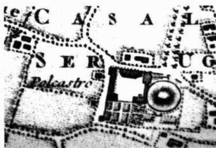
Particolari del portale con la trifora soprastante e di una finestra del fronte principale La balaustra della trifora prima dei lavori di restauro Il complesso nella "Gran Carta del Padovano" di Rizzi Zannoni (1780)