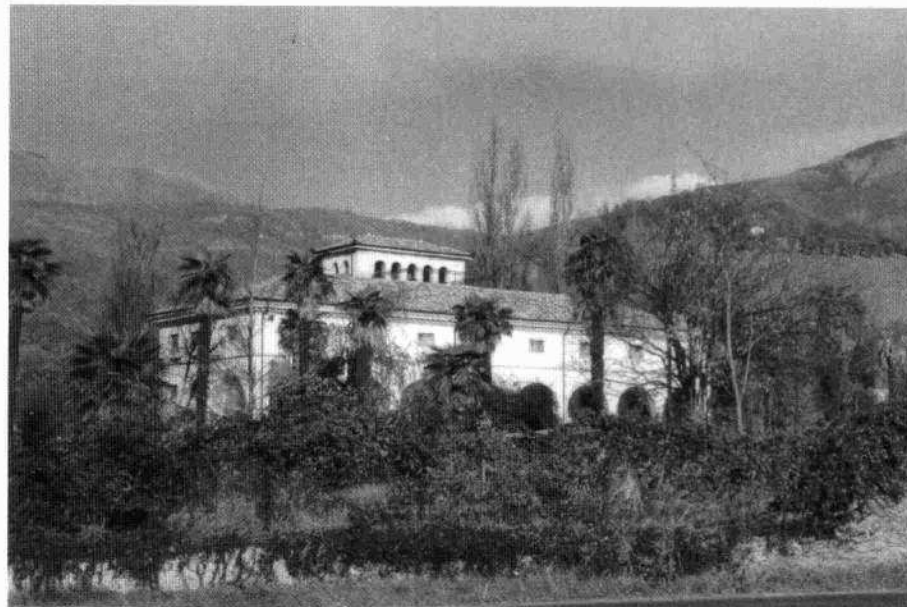
Il viale in asse con la facciata principale (L.S. 1998) Veduta della barchessa (L.S. 1998)

La barchessa, attualmente utilizzata come serra, ha pianta rettangolare ed il fronte principale caratterizzato da una sequenza di archi a tutto sesto che si sviluppano a doppia altezza arricchiti nella chiave di volta da volti umani in pietra. In corrispondenza di ogni arco è posta una piccola finestrella rettangolare. L'edificio, che ha il tetto a padiglione, nella parte centrale presenta un ulteriore volume sopraelevato, raggiungibile dall'interno, con piccolo terrazzo nella parte anteriore.