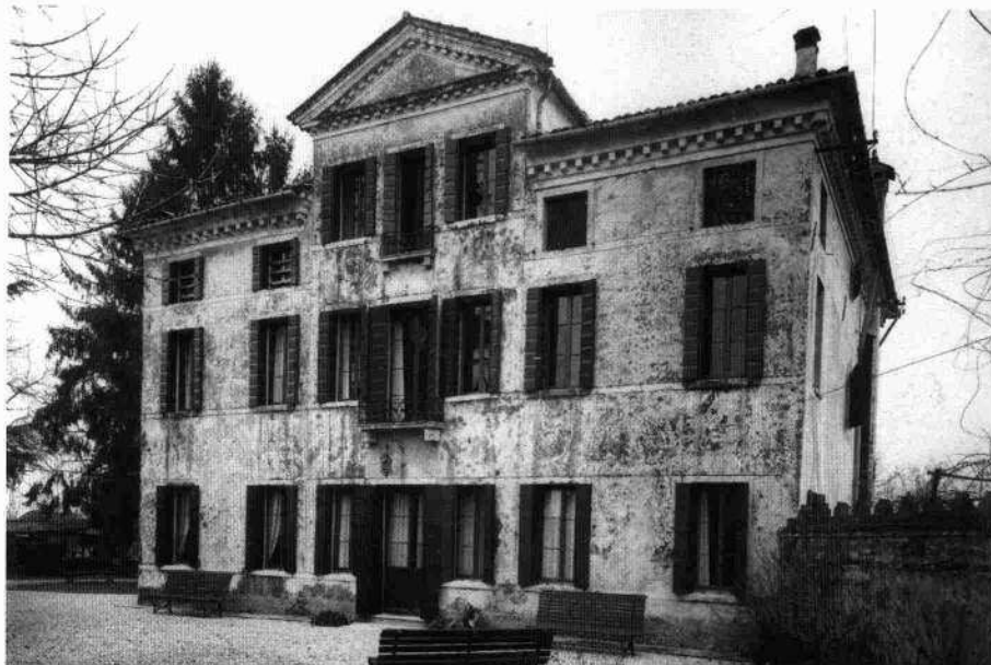
Scorcio della barchessa orientale (Archivio IRVV) Il fronte nord della villa (Archivio IRVV)

Sul fronte settentrionale, nella superficie di interesse tra le due aperture di estremità, sono ancora visibili le tracce di due ghiera d'arco incise nell'intonaco di facciata, probabili resti di decorazioni parietali.