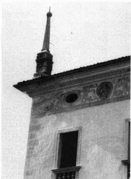
L'oratorio (L. De Bortoli, 2003) Particolare di un obelisco e della decorazione sottogronda (Archivio IRVV, 1972)

Verso nord si trovano i corpi dei rustici, un tempo a servizio delle vaste proprietà terriere. Addossata all'ala ovest delle scuderie, comprendenti al piano superiore appartamenti di servizio, è una corte chiusa