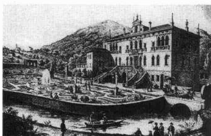
La villa e il giardino nella litografia di Marco Moro (da: Vecellio, 1876) Veduta del complesso