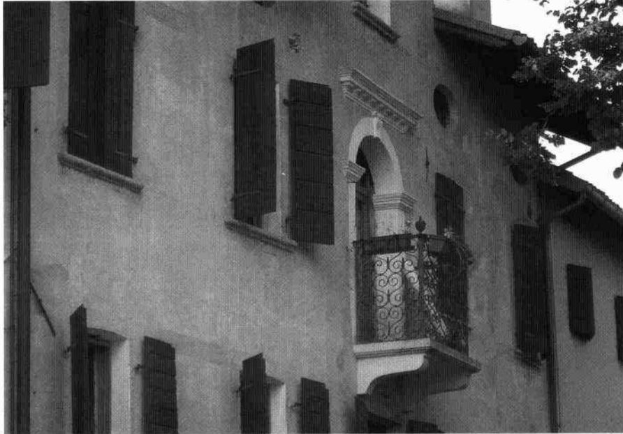
Veduta del fronte nord (L. De Bortoli, 2003) Veduta di scorcio della villa in una foto degli inizi del Novecento (L. De Bortoli, 2003)

Il cortile, al cui centro vi era un pozzo con vera in pietra, era delimitato da un alto muro di cinta. Con la famiglia Bottari la villa venne restaurata e ampliata. Il notaio Nicola vi stillò parecchi atti. Nel 1788 Nicolò Bottari la cedette a Giovanni, della stessa famiglia, il cui fratello Pietro, divenuto canonico, vi morì. Nel 1804 Biasio lasciò tutti i suoi averi ai figli Marzio e Antonio. Morto l'ultimo discendente Vittorio nel 1871, la villa passò ai cugini Antonio e Giovanni Zugni che la possedettero fino al 1873 quando risulta appartenere a Giacomina Bassani. Il figlio di questa, Giovanni Bertelle, la vendette nel 1905 ai co-