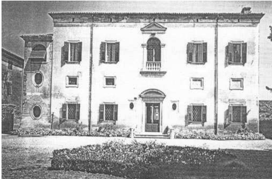
La facciata a sud

considerare la costruzione come uno dei nostri monumenti architettonici». A metà del Novecento venne ceduta all'ospedale di Albaredo e successivamente al Fontana che intervenne sull'edificio realizzando un intervento di accurato restauro.