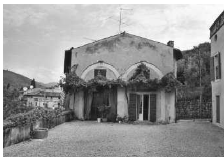
La barchessa con i due grandi archi simili oggi murati (Archivio IRVV) Veduta della barchessa a quattro archi con conci a bugnato (Archivio IRVV)