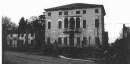
La statua nel giardinetto antistante la facciata Il fronte settentrionale La testata sulla strada degli annessi rustici a nord e il muro di cinta La facciata principale della villa