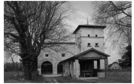
Colombara a nord (B.S.) Fronte settentrionale (B.S.)

Da una analisi della struttura muraria si intuisce che la testata occidentale dell'ala più bassa del corpo padronale, stilisticamente riconducibile al Cinquecento, leggermente più larga del settore che la collega alla villa e con aperture molto diverse, è probabilmente l'elemento più antico del complesso, su cui è stata costruita la fabbrica attuale a cavallo tra il XVII e il XVIII secolo. Gli interventi ottocenteschi hanno riguardato solo la parte antica, risparmiando la villa. Non è chiaro dove esattamente dovesse sorgere l'edificio palladiano, ricostruibile solo sulla base della tavola dei Quattro Libri , ma recenti ipotesi lo collocerebbero nel prato tra la villa e la colombara a est e la barchessa a ovest della proprietà. Non si sa nem-