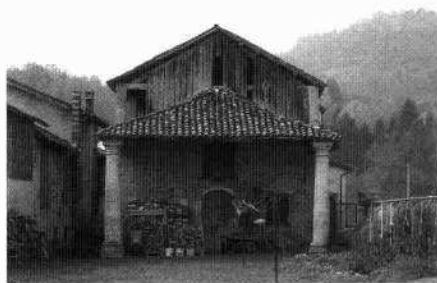
Annesso rustico (L. De Bortoli, 2003) Veduta di scorcio del retro della villa (L. De Bortoli, 2003) Torre sud (L. De Bortoli, 2003)

zione, presenta al pianterreno una traccia ancora visibile di un'apertura ad arco, parzialmente demolita per realizzare un ingresso. Su un lato del giardino d'ingresso si trova inoltre un rustico, il cui portico, seppure parzialmente trasformato, presenta due massicce colonne tuscaniche in laterizio che sorreggono un'interessante copertura in legno a capriate.