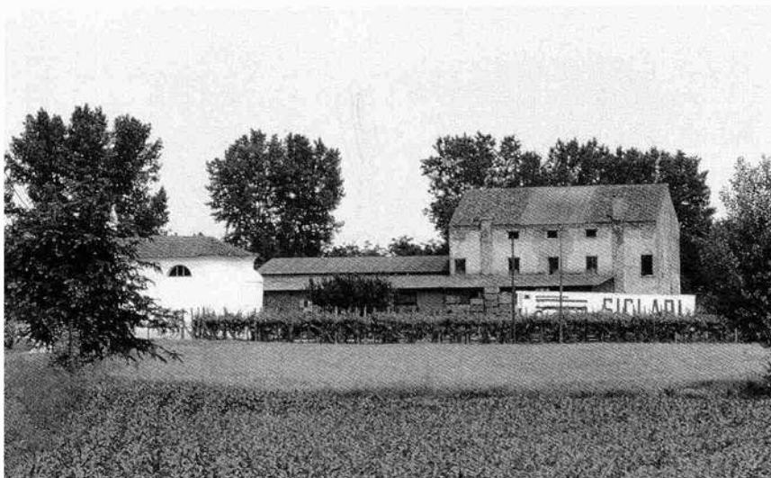
Il complesso edificato visto da sud

L'assetto planimetrico è tripartito, con sala