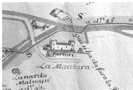
Mapa del 1711 che ritrae la corte