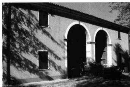
La partitura mediana della facciata meridionale La chiesetta La villa vista da nord La barchessa