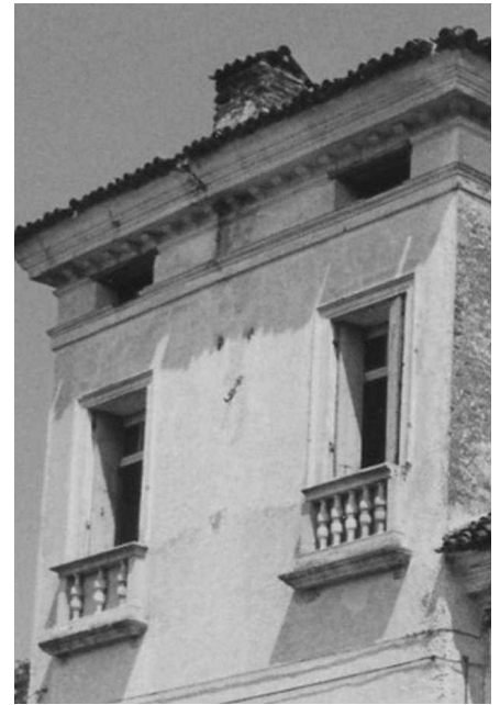
Particolare del corpo padronale