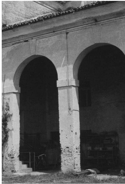
Particolare della barchessa

S'ignorano i nomi del committente e dell'architetto. L'analisi stilistica della sola ala compiuta denuncia un progetto di respiro grandioso che sembra ispirarsi ai moduli palladiani in voga tra la fine del XVI secolo e gli inizi del secolo successivo (Cevese 1971).