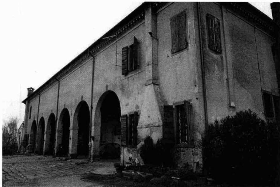
Particolare della testata est I fornici del prospetto volto a sud