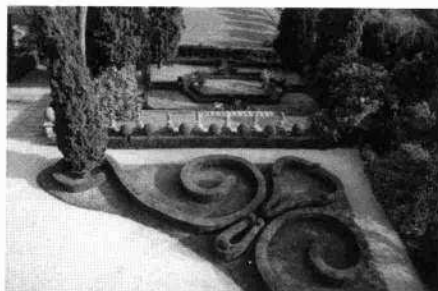
La villa in una vecchia foto degli anni cinquanta