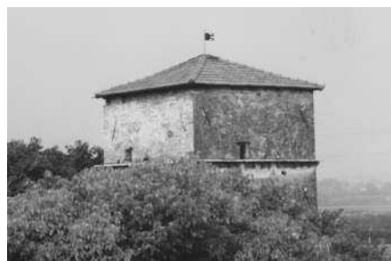
L'antica torre colombara (Archivio IRVV) Disegno del 1806 del progetto dell'architetto vicentino Ottone Calderari (Archivio privato Avrese)