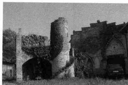
Particolare dell'inserimento tra la torre ottagonale ed il corpo della villa Veduta di edifici appartenenti alle false rovine La torretta circolare delle false rovine