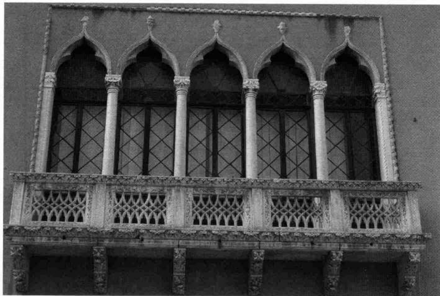
Una monofora e la pentafora del piano nobile