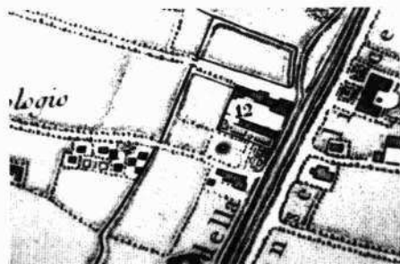
La villa nella "Gran Carta del Padovano" di Rizzi Zannoni (1780) Testata orientale del corpo padronale Parte delle adiacenze viste dalla corte interna