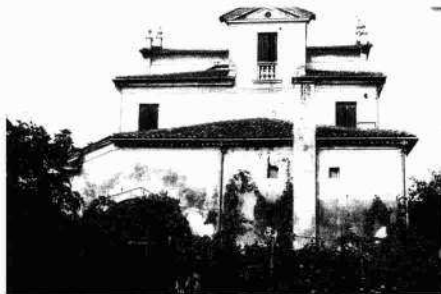
Particolare della facciata Gli annessi Il fronte meridionale della barchessa occidentale Il fianco occidentale della villa