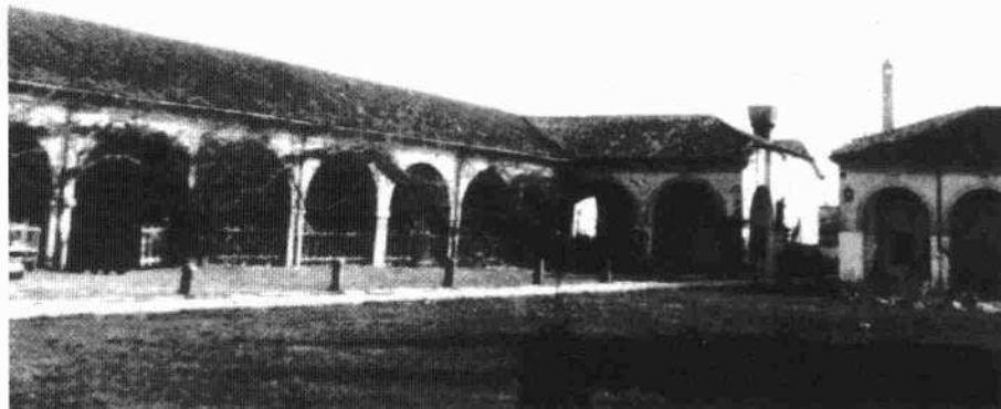
Il complesso visto da meridione La corte

Gli annessi hanno ampi porticati con fornicati a pieno sesto poggiati su pilastri.