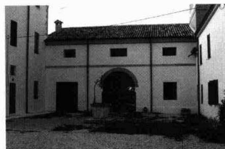
Vedute della chiesetta Scorcio del fianco sud-orientale della villa La corte interna con il pozzo