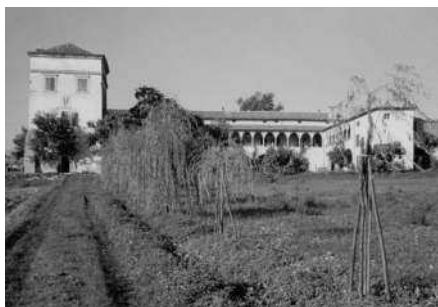
Veduta del complesso dalla campagna con la torretta colombara che domina la corte interna