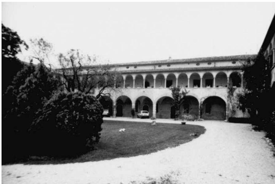
Vista della facciata principale della villa che dà sul cortile interno