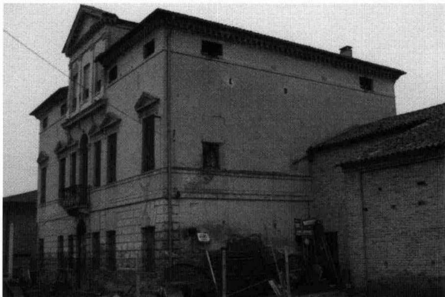
Il prospetto settentrionale L'angolo sud-est della villa visto dalla corte