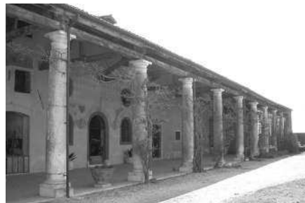
Prospetto posteriore della casa padronale (N.L.) Barchessa che chiude la proprietà a est (N.L.) Portico della barchessa (N.L.)