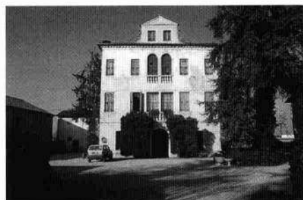
Il fronte della cappella La villa in un disegno settecentesco Particolare della barchessa occidentale Il fronte meridionale della villa