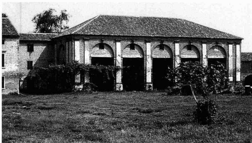
La casa padronale: fronte meridionale e schema planimetrico del piano terreno

Il fronte meridionale della barchessa (M.B. 1989)