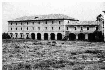
Il fronte meridionale della casa padronale (R.M. 1989)

Particolare della mappa del Catastico veneto del 1775, Ritratto di Santa Giustina, Comun di San Martin, ACR, m. 96, mp. 100