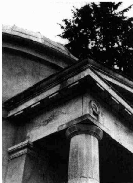
Il tempietto Particolare del pronao