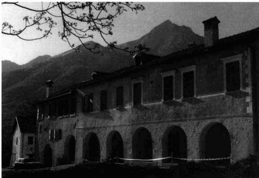
Veduta dell'edificio da est, dopo il restauro (S. Chiovaro, 1995)

e architrave-cornicione e provviste di serramenti in noce intagliato. Quattro camini in pietra sono collocati nelle varie stanze; uno di questi presenta un fregio affrescato sulla cappa» (Padoan, 1999). A conferma del linguaggio colto usato all'interno sono certamente da citare i solai alla sansovina dipinti e la bellissima volta a ombrello, con velette perimetrali, che si trovava un tempo nel vano principale del pianterreno. Accanto alla villa sorge il piccolo oratorio con la piccola torre campanaria posta all'angolo della facciata.