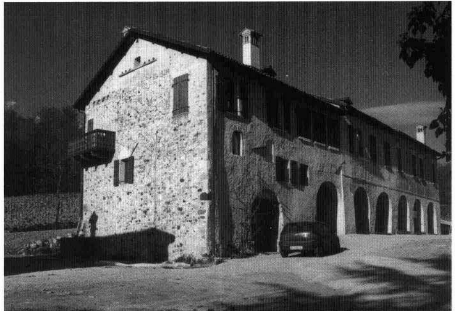
Veduta dell'edificio prima del restauro

Il corpo padronale, di forma allungata, è disposto