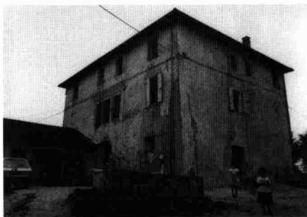
Veduta del retro del complesso Veduta laterale della villa

Certo è che le funzioni agricole, progressivamente implementate negli anni, hanno parzialmente sacrificato la villa e il suo giardino. Nonostante il persistere di alcuni interrogativi, è però auspicabile che nasca un giorno la consapevolezza dell'importanza dell'edificio e la volontà di recuperarlo nella sua tipicità.