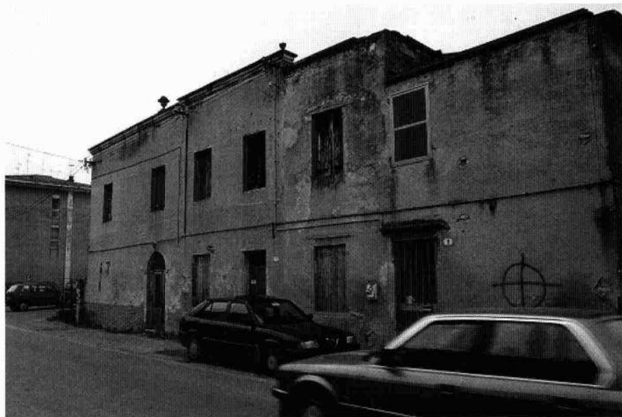
Veduta del fronte orientale L'affaccio sulla strada