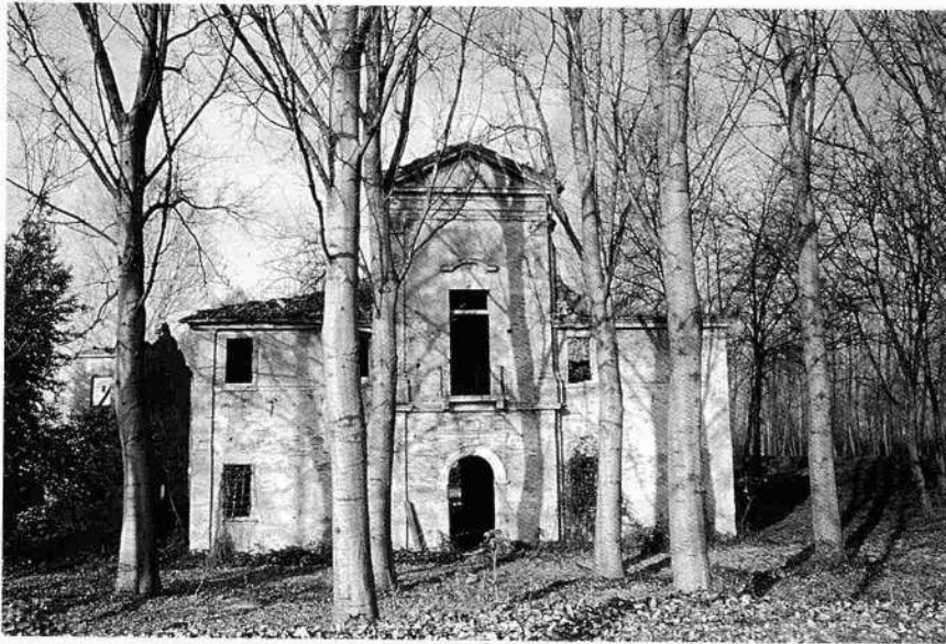
Il fronte principale della casa padronale (G.T. 1999)